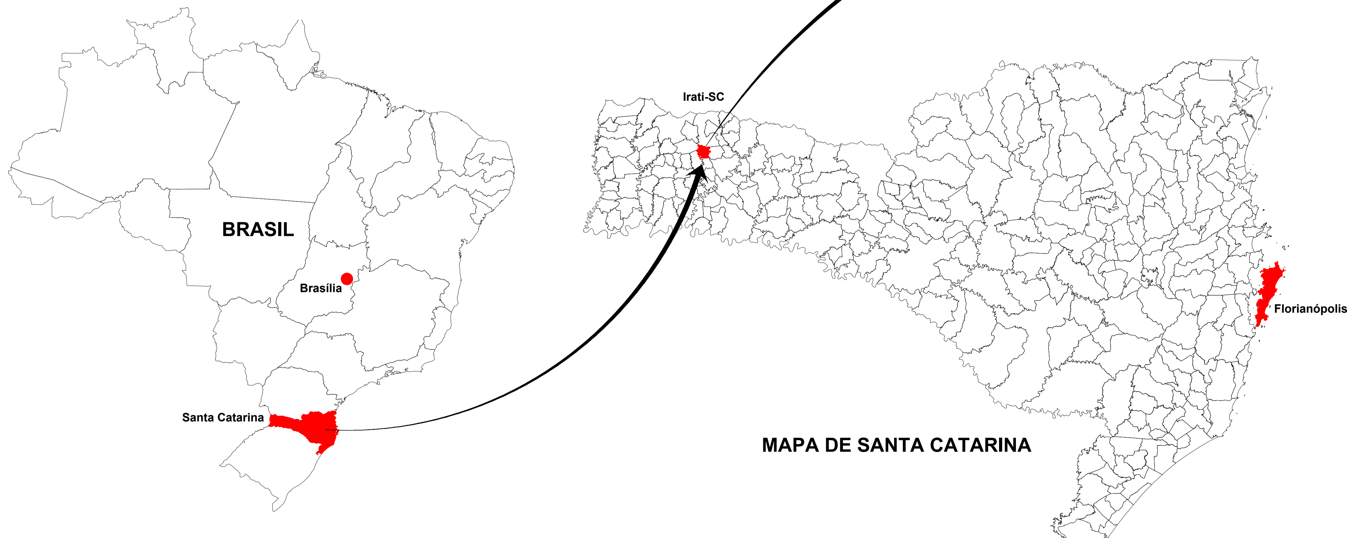
IMPLANTAÇÃO - PLANTA DE LOCALIZAÇÃO Escala Visual