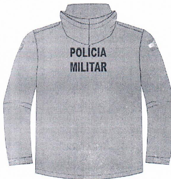
JAQUETA LADO EXTERNO