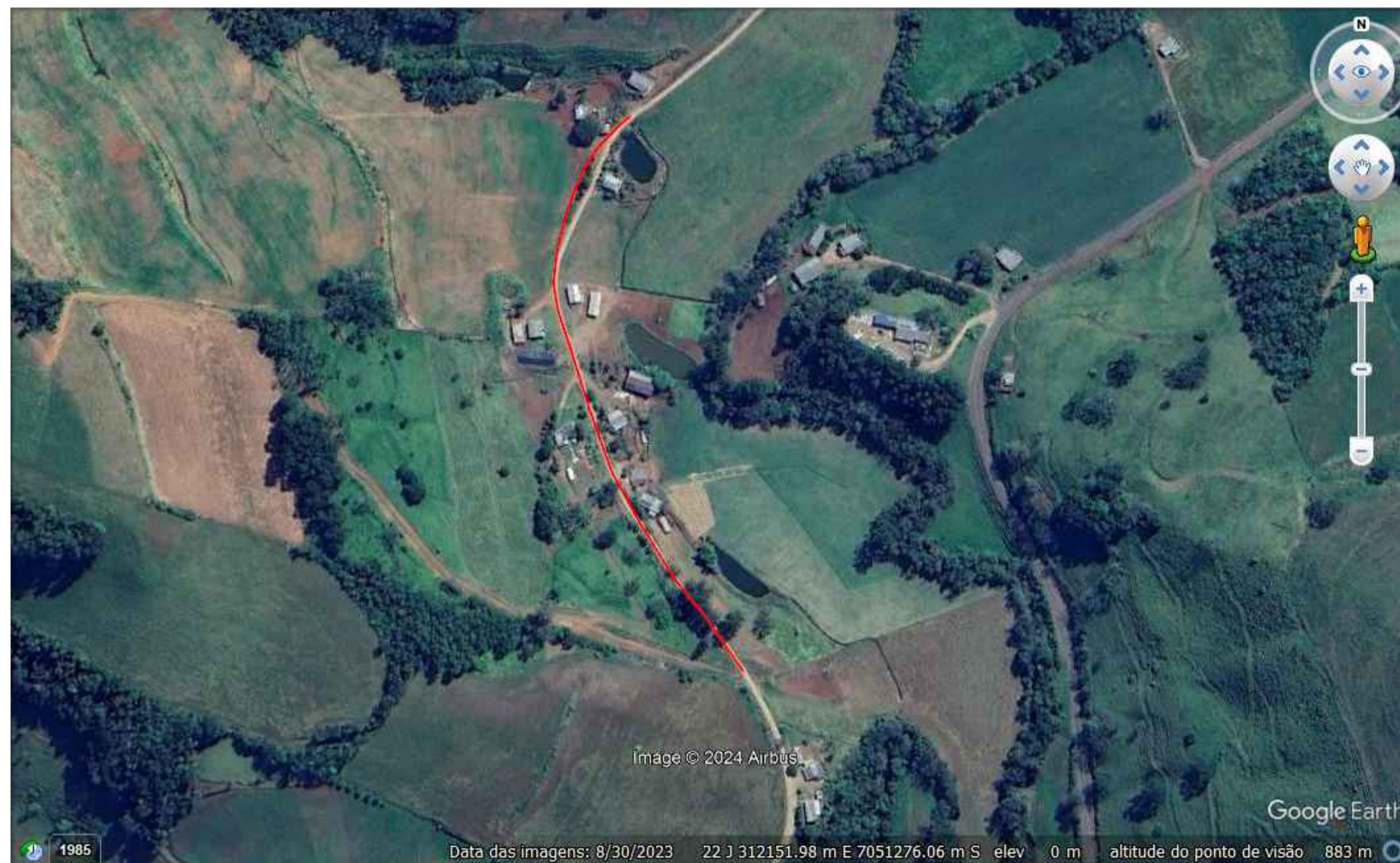
IMPLANTAÇÃO - PLANTA LAYOUT SATÉLITE VISÃO LOCAL Escala Visual