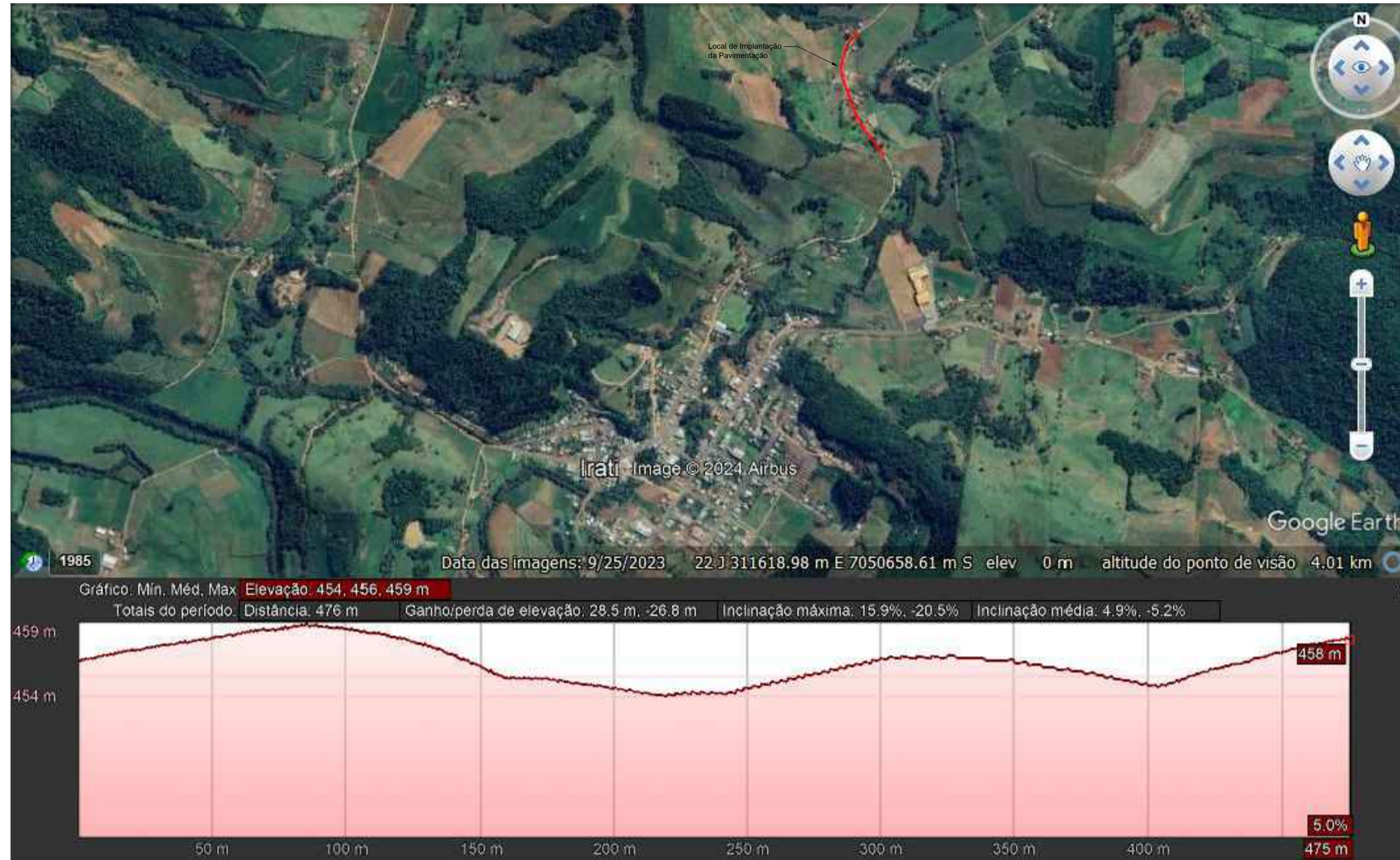
IMPLANTAÇÃO - PLANTA LAYOUT SATÉLITE VISÃO GERAL Escala Visual