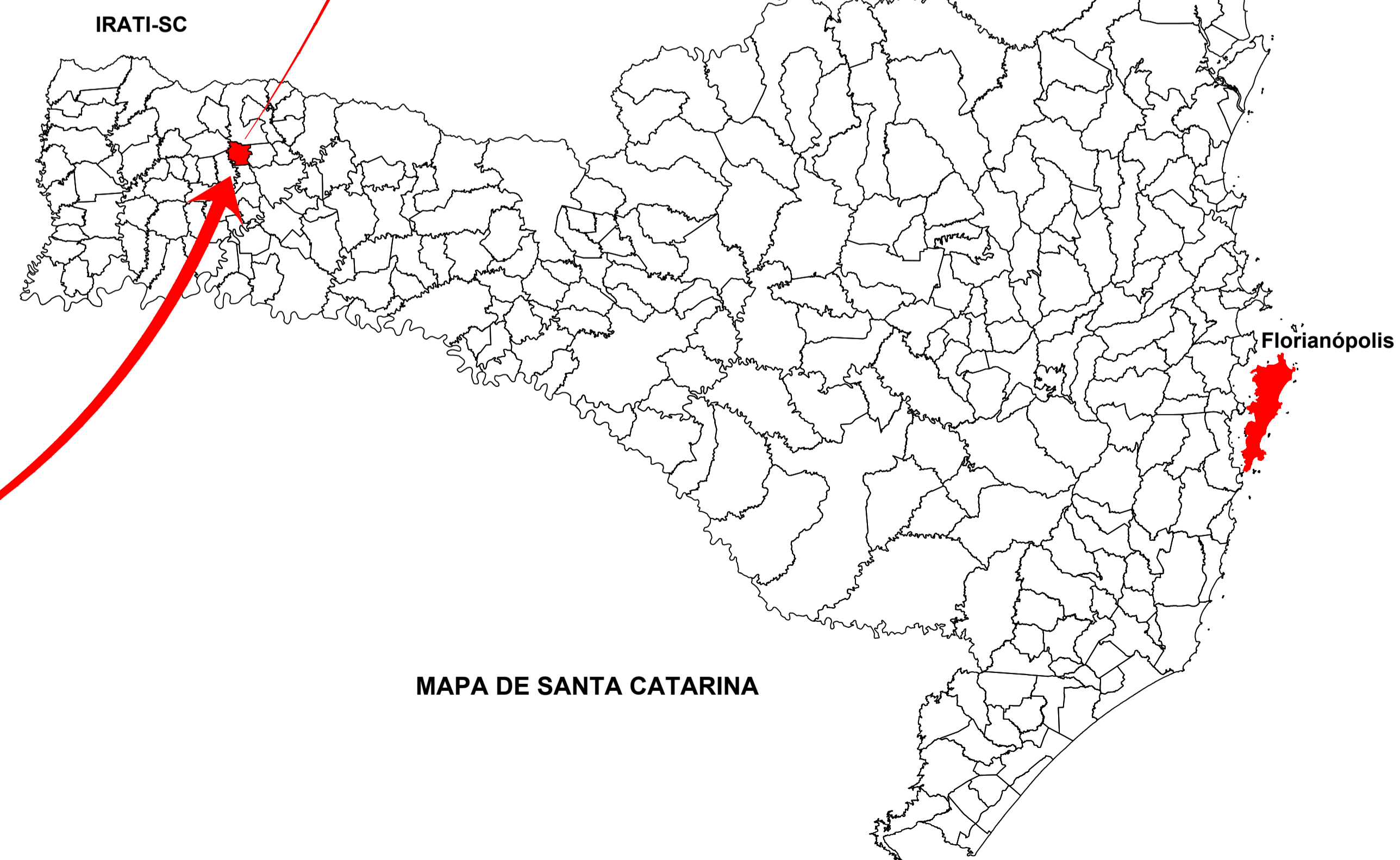
IMPLANTAÇÃO - PLANTA DE LOCALIZAÇÃO Escala Visual