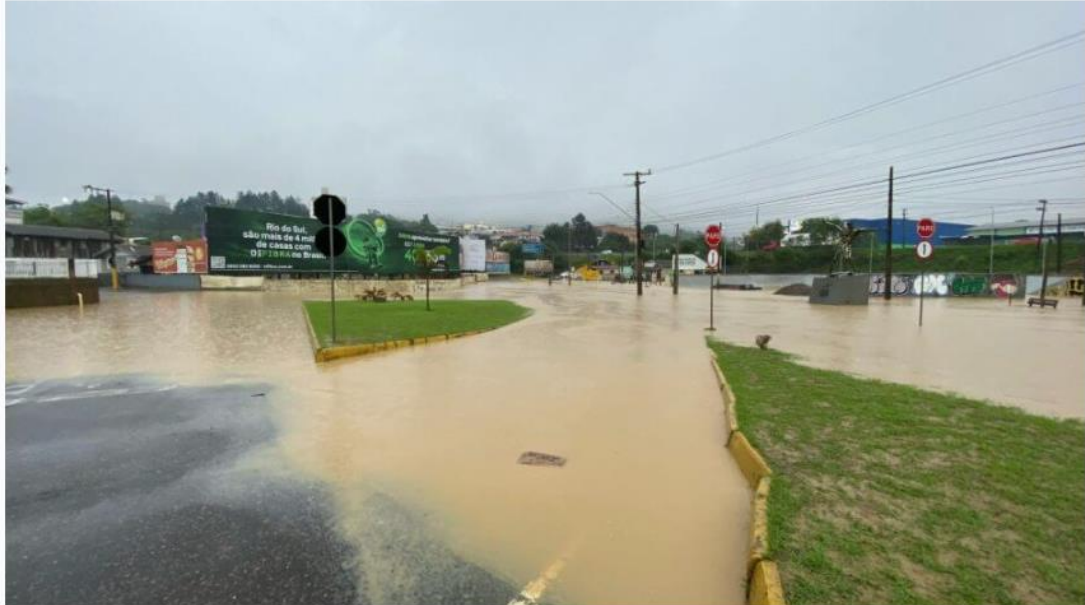
Rua Wenceslau Borini na manhã desta quinta-feira (16)

Rio do Sul voltou à situação de enchente na manhã desta quinta-feira (16). Segundo a medição das 11h, o nível do Itajaí-Açu alcançou 7,54 metros. Essa é a quinta inundação na cidade somente neste ano. A prefeitura precisou abrir oito abrigos para receber as famílias atingidas.