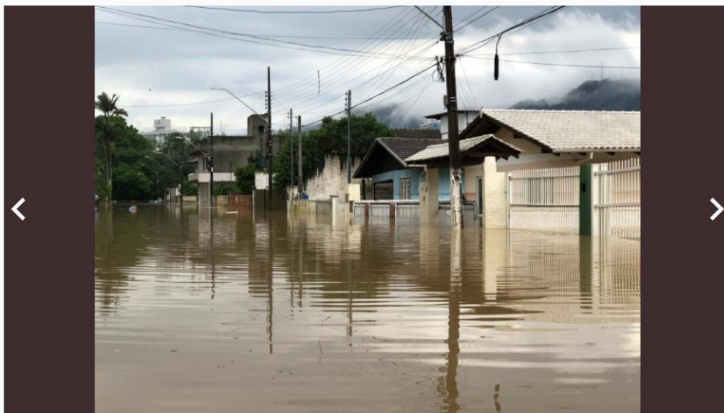
Rio do Sul na manhã desta sexta-feira