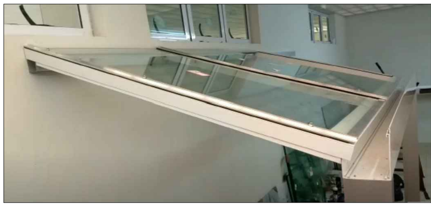
04 MODELO ESTRUTURA E VIDRO TEMPERADO - FRONTAL SEM ESCALA