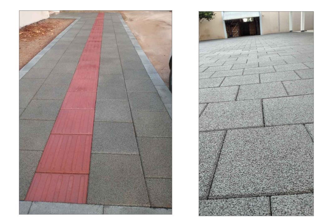
Modelo de pavimentação a ser executado * A mesma deve ser com juntas desencontradas