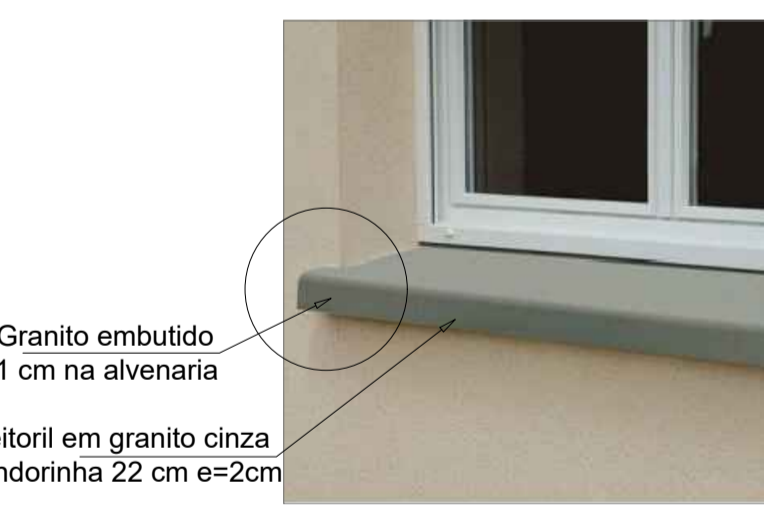
DETALHE- PEITORIL SEM ESCALA