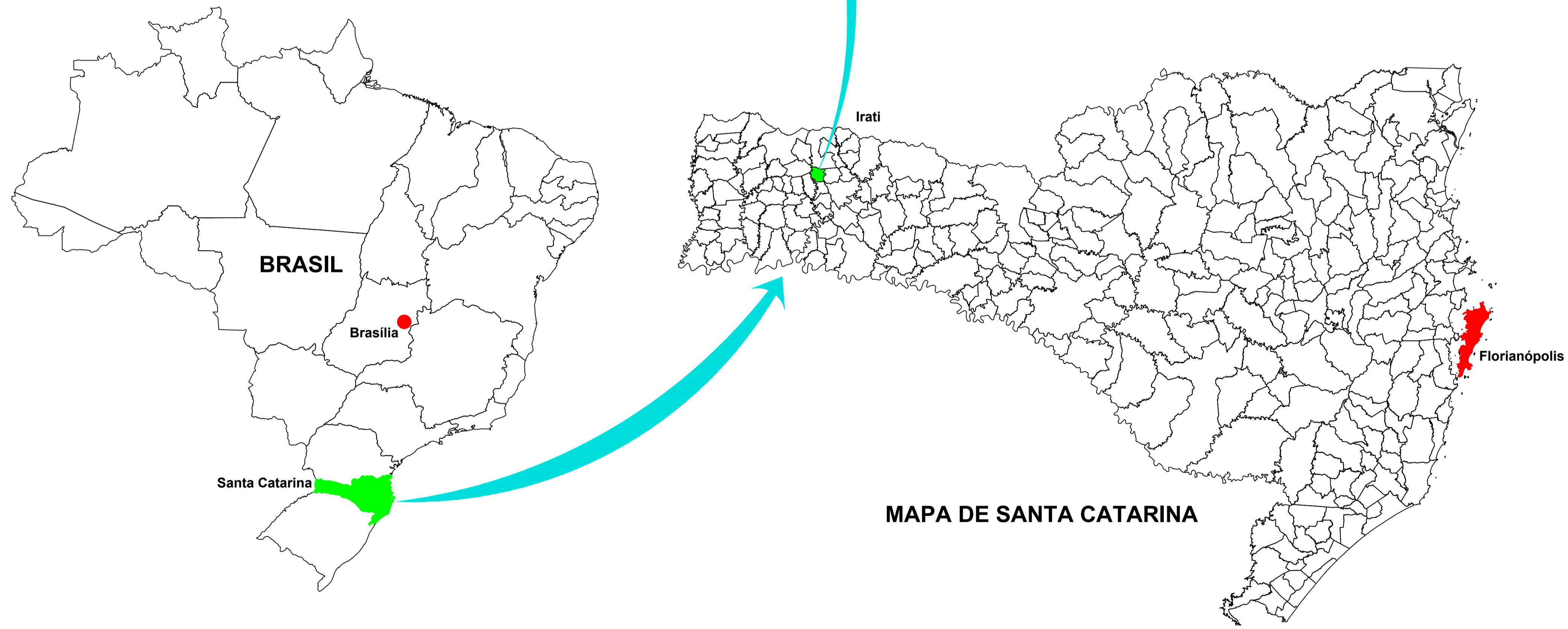
MAPA DE SANTA CATARINA