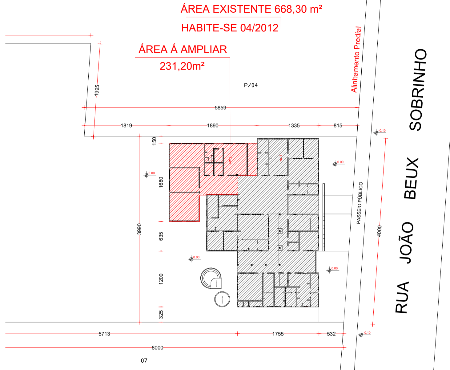
Planta De Localização Escala 1/500